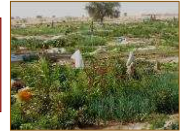
Création de périmètres maraîchers