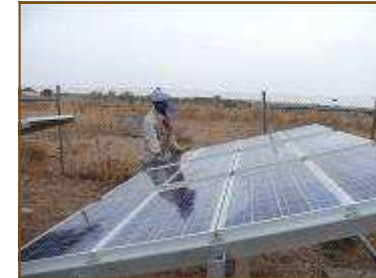
Énergie solaire pour exhaure de l'eau