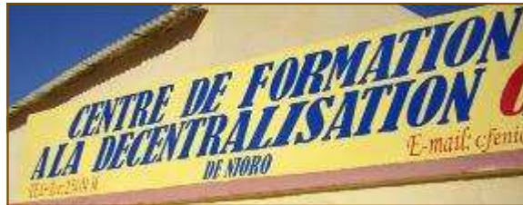
Centre de ressources et de formation à la décentralisation