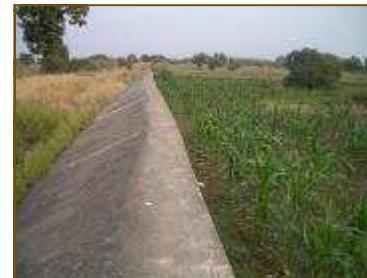
Micro-barrage, à droite culture de maïs.