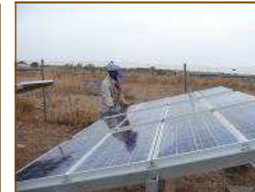
Énergie solaire pour pompage de l'eau

Réalisation puits & adductions d'eau potable