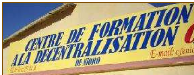
Centre de ressources et de formation à la décentralisation