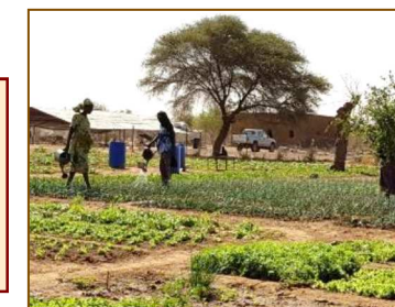
Création de périmètres maraichers