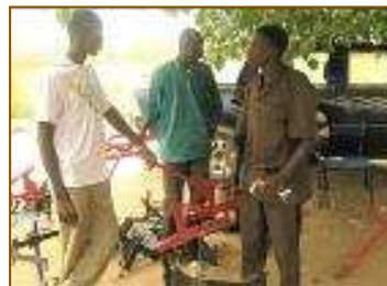
Aménagement de bas-fonds en zones agricoles. Réalisation de micro-barrages